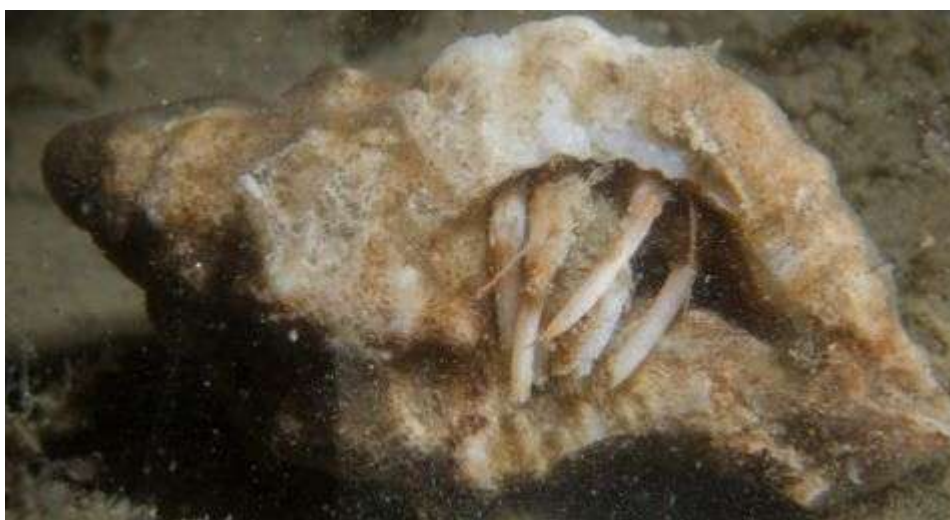
Grote heremietkreeft in fossiele Stekelhoorn

Vorige week is echter in de Oosterschelde een Grote heremietkreeft aangetroffen in het slakkenhuis van een Stekelhoorn. Het is een fossiele schelp uit het Pleistoceen en is tenminste 11.500 jaar oud, maar waarschijnlijk zelfs nog veel ouder. We mogen dus met recht zeggen dat dit een Heremietkreeft is die in een zeer bijzonder historisch monumentaal pand woont.