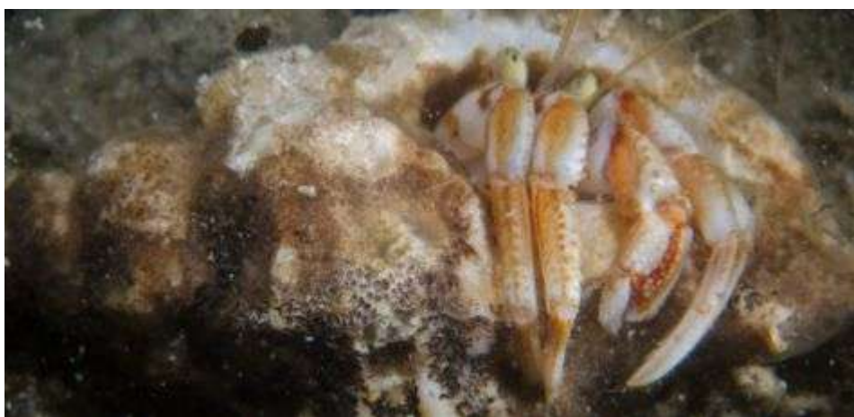
Grote heremietkreeft in fossiele Stekelhoorn, Oosterschelde, 2011

Heremietkreeften hebben een pantser dat niet goed is ontwikkeld. Ze verstoppen zich in lege schelpen van huisjesslakken. Daar danken zij ook hun naam aan. Bijna altijd worden de Heremietkreeften aangetroffen in slakkenhuizen die recent zijn vrijgekomen door het overlijden van de originele bewoner.