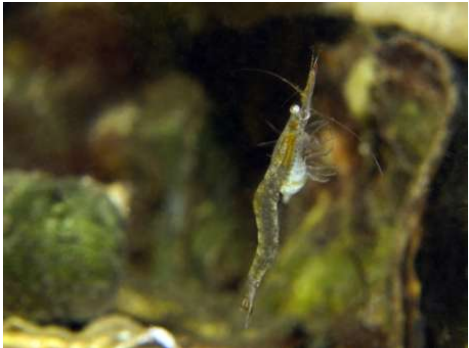
De originele foto

Op de foto van fotoraadsel 10 stond geen "watervlo" :-)