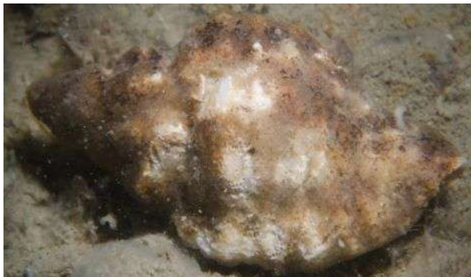
Fossiele Stekelhoorn, Oosterschelde, 2011

De Stekelhoorn, Ocenebra erinacea , is ook een soort die hier in het Pleistoceen voor kwam. Hij is nu bekend van de West-Europese kust maar komt waarschijnlijk niet autochtoon (levend) in het Zeeuwse kustgebied voor. Ze worden incidenteel aangevoerd met geïmporteerde schelpdieren. De Stekelhoorn waar deze Grote heremietkreeft in zit is een fossiel exemplaar.